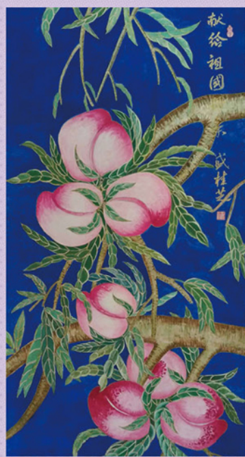
献给祖国 盛桂芝画

母亲老了 满头白发像芦苇飘扬 岁月的犁刻下她满脸的皱纹 母亲老了 她额头上的阡陌 寄望儿女们长大成人 待到山花烂漫时 收获母亲心中的希望