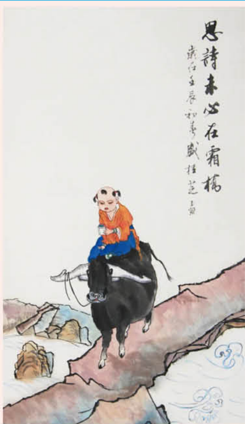
思诗未必在霜桥 盛桂芝 / 画

更懂得了父母在供品上倾注的孝敬和虔诚。每年春分刚过，父母就商议着清明给老人上坟、准备供品。供品要老人在世时最喜欢的，要鲜亮受看的，还要符合老一辈人讲究的。 枣糕是不能少的，尽管做枣糕要花很多功夫，挑又大又实成的枣，蒸后去核与皮，枣肉打成泥，和鸡蛋搅进面里，反复揉，切成型，上锅蒸，母亲总要早早准备。后来，母亲年龄大了，做饭费力了，但每年清明她还要自己做枣糕。我说买现成的吧，你做不动了，母亲说，不行，你爷爷奶奶最愿意吃我做的枣糕了！母亲执着的话语，使我不能说什么了。 再后来，母亲也去世了，家里人也年年清明给老人上坟，供品少不了枣糕，这是我们后辈人从母亲手里学会的只有在清明上坟时用的面食。上完坟，我也把供品带回家来，不过，孩子们都不太喜欢吃供品，只有我嚼着枣糕，依然感受到一种浓浓的枣糕的味道，那是清明的味道，更是母亲的枣糕的味道。