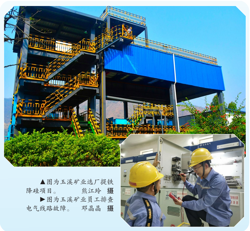
▲图为玉溪矿业选矿厂提铁降硅项目。 ▶图为玉溪矿业员工排查电气线路故障。

玉溪矿业将认真贯彻落实上级决策部署，持续强化政治引领，锚定全年目标任务，抢抓新机遇、破解新难题、谋求新突破，奋进高质量发展“新征程”。