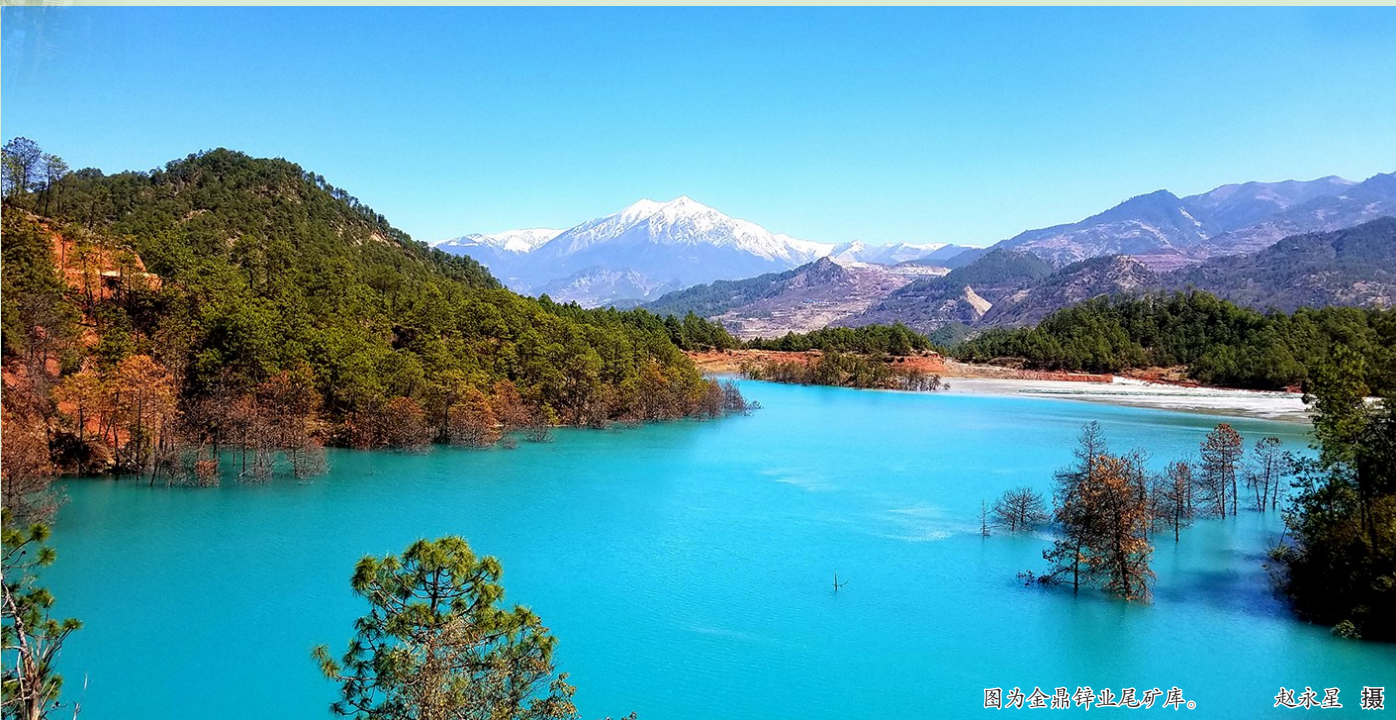
图为金鼎铝业尾矿库。