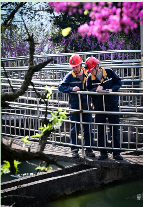
图为西南铝业厂沉清池。