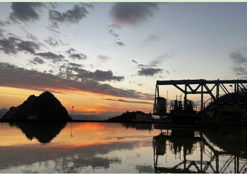
图为夕阳下的中铝股份广西分公司。