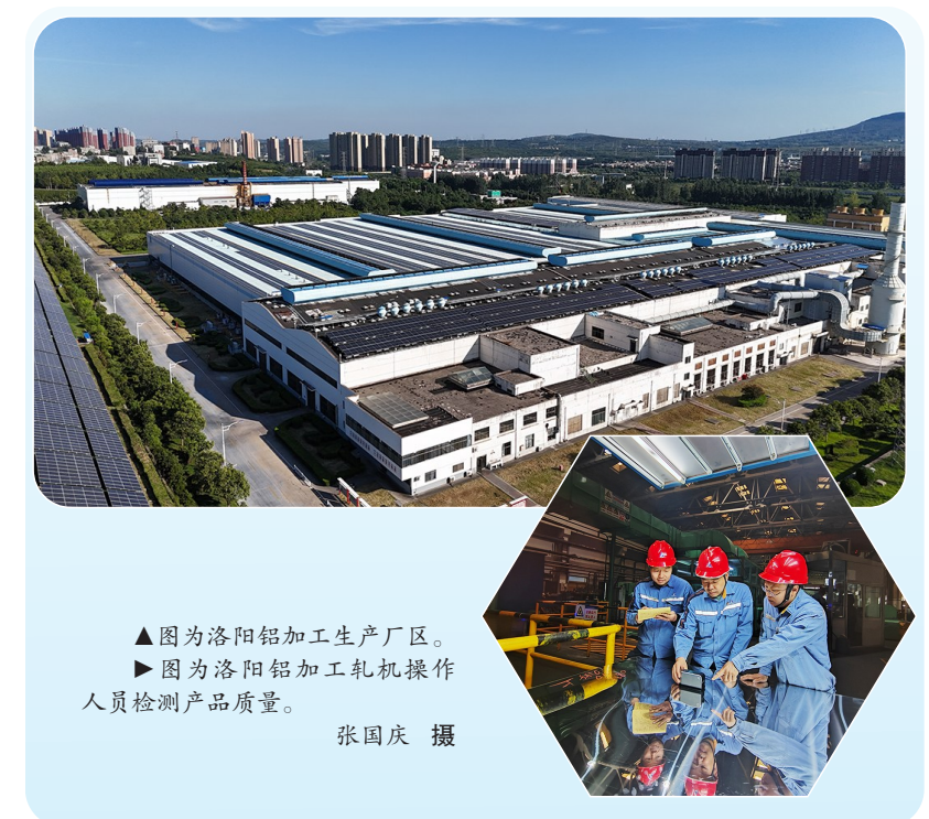
▲图为洛阳铝加工生产厂区。 ▶图为洛阳铝加工机操作人员检测产品质量。

“两提一降”筑根本。洛阳铝加工锚定“提质、提效、降本”三大核心工作，让高质量发展的动力更足、底气更足、成色更足。一季度，精整车间持续推进设备技改工作，先后对1700吨弯矫高压清洗箱、退火炉装出炉机构、横剪1号垛板台等实施技术改造，有效防止了产品板面