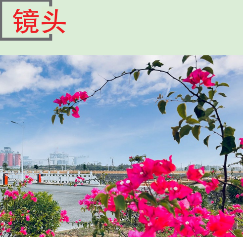
图为鲜花簇拥的广西华昇厂区。